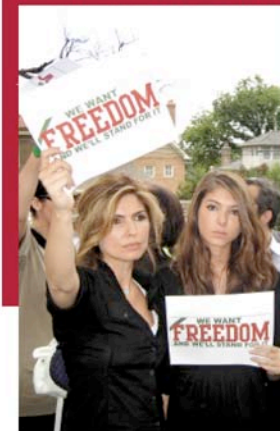
FREIHEIT FÜR IRAN. Prinzgemahlin Yasmine und Tochter Noor bei einer Demo.