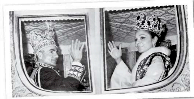
POMP & PRUNK. Kritiker warfen der Pahlavi-Dynastie vor, mit allzu großem Pomp und Prunk zu regieren, während Teile der Bevölkerung weiter hungerten.

Religion geben soll. Ob das letztendlich aber eine parlamentarische Monarchie oder eine Republik wäre, sollte erst ganz am Ende des Weges, in Form einer Volksabstimmung, entschieden werden.