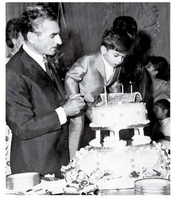
IM BLITZLICHT. Egal ob der kleine Prinz Geburtstag hatte oder die Familie Urlaub in den Alpen machte, der Schah, dessen hübsche Frau Farah Diba und die Kinder waren die Medienstars der 70er-Jahre.

Pahlavi: Noch vor den Wahlen sprach Präsident Obama davon, einen vorbehaltlosen Dialog mit dem Regime führen zu wollen. Doch dann kamen die