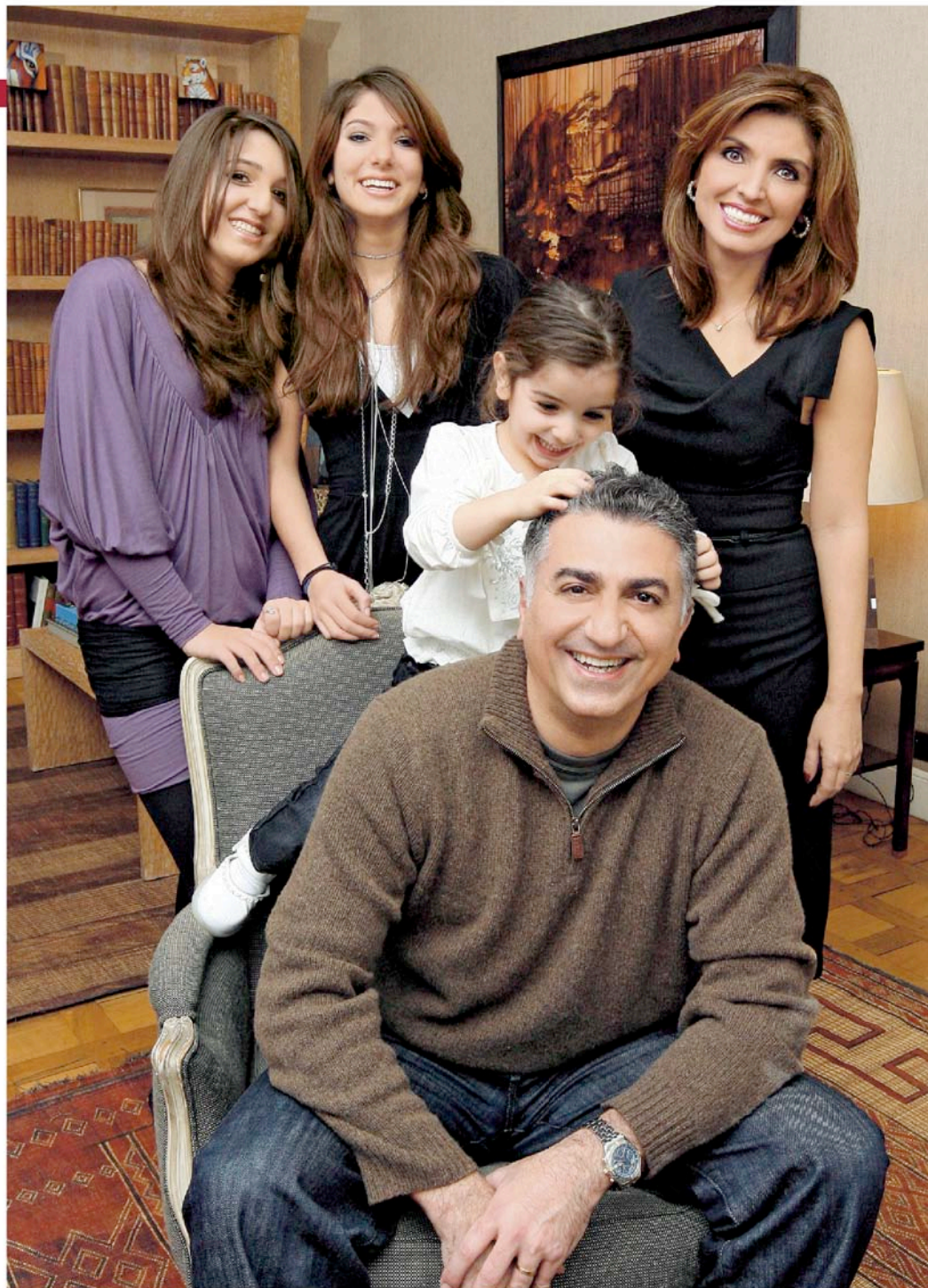
EINE KÖNIGSFAMILIE IN WARTESTELLUNG? Der 48-jährige Reza Pahlavi mit seiner Frau Yasmine, 41, und den gemeinsamen Töchtern Iman, 16, Noor, 18, und Farah, 5. Werden sie jemals auf den Pfauenthron zurückkehren?

NEWS: Doch auch die Bilanz Ihres Vaters fällt gespalten aus.