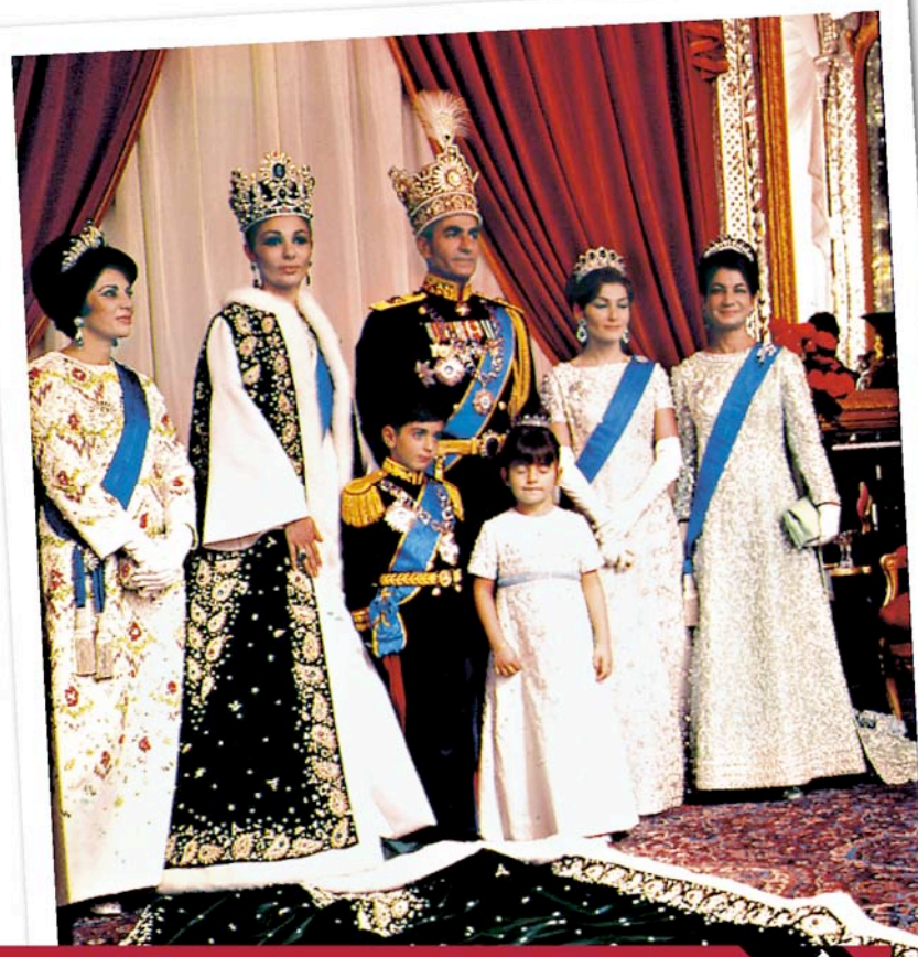
Reza Pahlavi – der persische Kronprinz

DAS INTERVIEW. Über das Mullah-Regime, dessen Atombombe, die Thronfolge & sein Österreich-Bild.